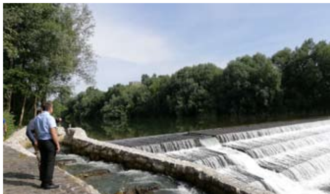
Ogled ribje steze