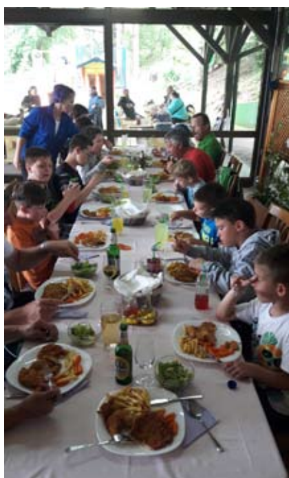
Najboljši v kategoriji U-10

R ibiška družina Velenje je od 21. 6. do 23. 6. 2019 organizirala tradicionalni tabor za mlade ribiče ribiške družine, ki je potekal ob gojitvenih ribnikih in v okolici Škalskega jezera. Mladi ribiči so pokazali, da so vztrajni, saj jih niti deževno vreme ni zmotilo. Večino časa so preživeli ob jezeru, nastanjeni pa so bili v šotoru, ki je bil postavljen za namen prenočevanja v času tabora. Za