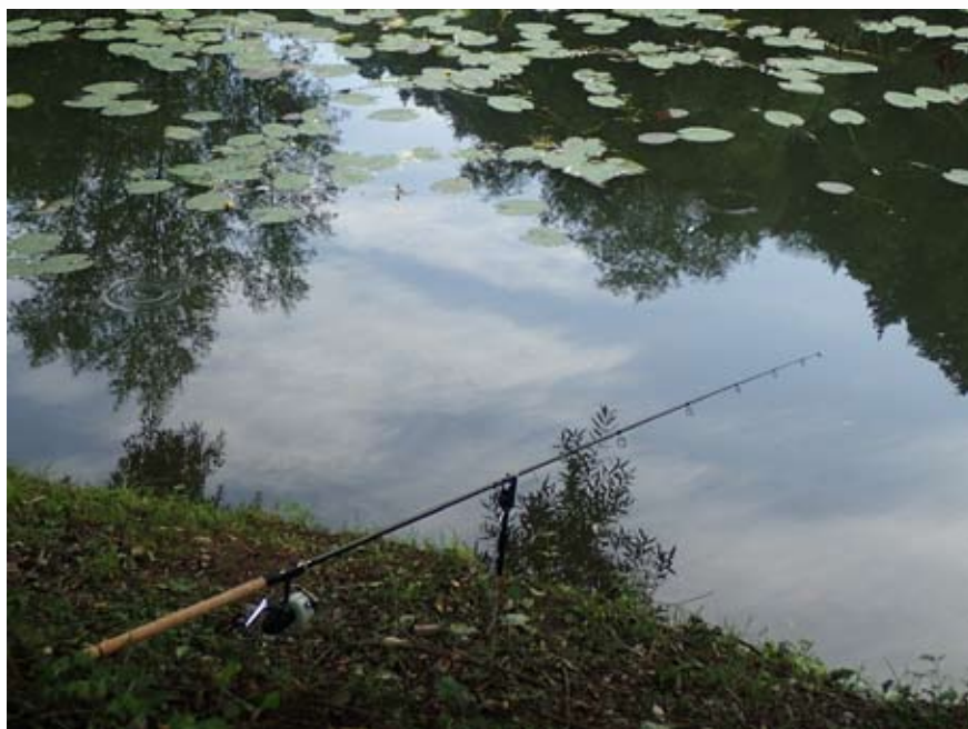
Šlajnarica na položaju. Tistega dne se je dvakrat dobro zakrivila.

Medtem se je že krepko zdanilo. Po navadi stopam po rosnih travah okoli Krnice še v temi, tokrat pa sem šel vsaj kako uro pozneje. Ni me motilo in začuda tudi moja pozabljivost name ni naredila posebno močnega vtisa. Le rahlo me je