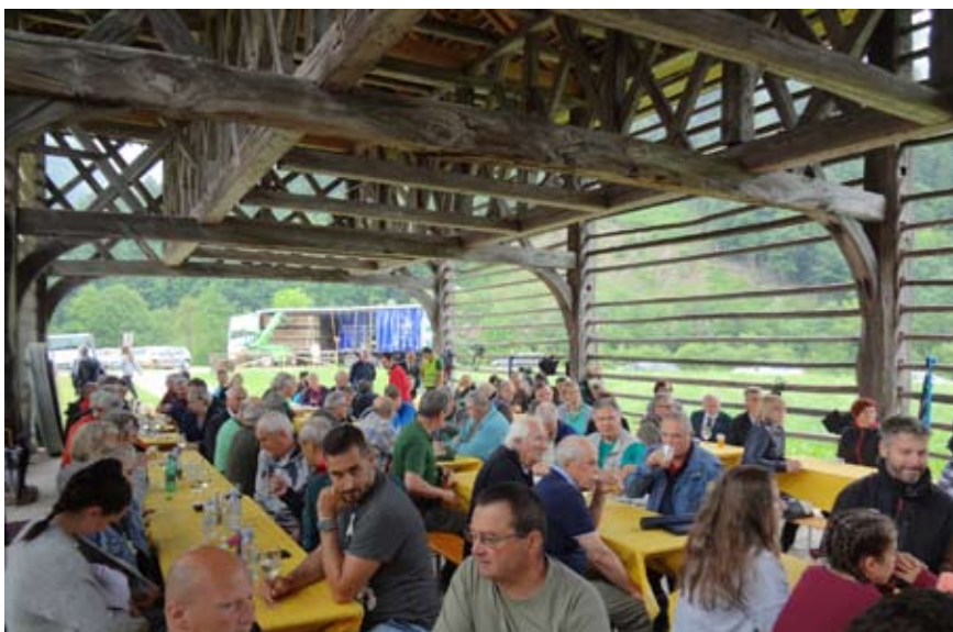
Proslavo 60-letnice je obiskalo kar nekaj ljudi