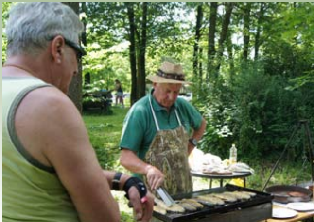
Marsikoga so k ribičem pripeljale lepe dišave. Pečena postrv ali ričet; med njima so lahko izbirali.