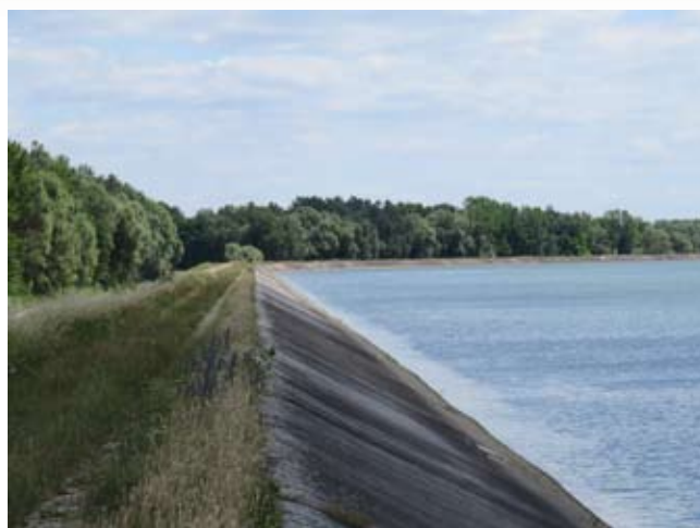
Ljudem in živalim neprijazna asfaltna brežina