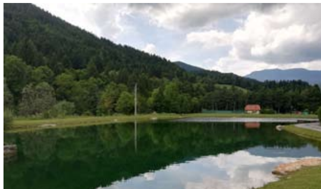
Ribnik RD Ljubno