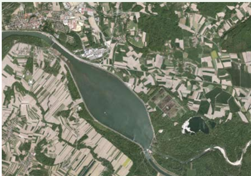
Ormoško jezero z lagunami iz zraka (Atlas okolja)