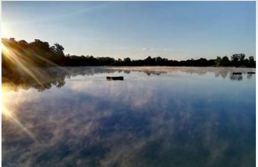
Gramoznica v svojem sijaju

Skratka, izbral sem mesto, razpakiral in pripravil hrano. Malo sem nahranil ribolovno mesto, saj sem menil, da tamkajšnje ribe niso navajene pritiska in sem raje nakrmil manj,