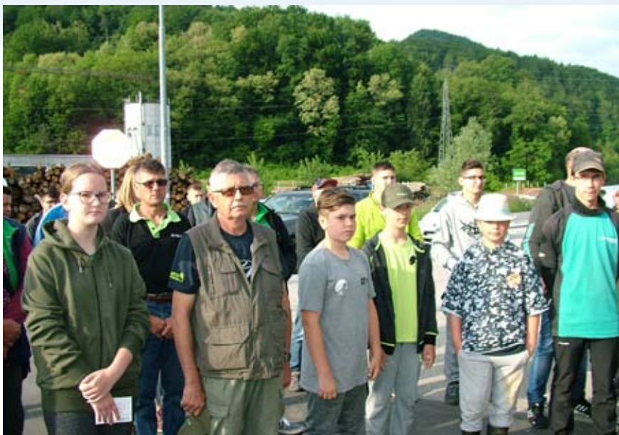
Z jutranjim zborom udeležencev se je začelo dvodnevno DP.

Počasi tekoča Sava je skrivala tisti pravi odgovor, ki bi ga želel slišati sleherni mladi ribič: ali bo tokrat