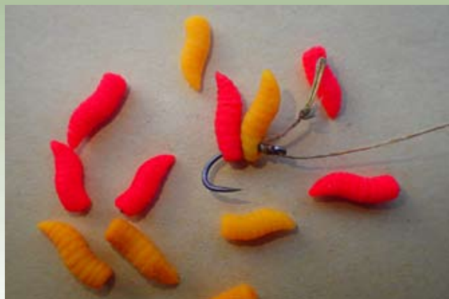
Zaradi pozabljivosti sem moral gumijasta kostna črva nataktni neposredno na trnek in ne na lasek, kot je bilo prvotno mišljeno. Linj se je vseeno ujel.