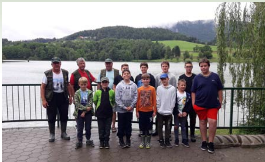
Udeleženci tabora z mentorji