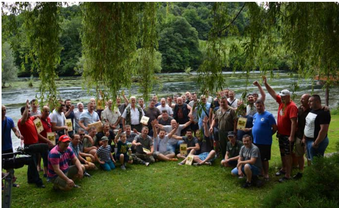
Udeleženci lova sulca

Po čem je lov sulca na Uni drugačen kot pri nas? Loviti ga začnejo že junija. Lovijo ga lahko tudi ponoči, vendar v spremstvu ribiškega vodnika na način ujemi in spusti. Lovijo ga z brega ali iz čolna, na umetne vabe, ne manjše od 10 cm. Letos so v želji po čim bolj humanem odnosu do sulca uvedli še pravilo, da se lovi izključno z enojčki na umetnih vabah. Vsak tekmovalac je dobil kodo, s katero je z mobilnim telefonom