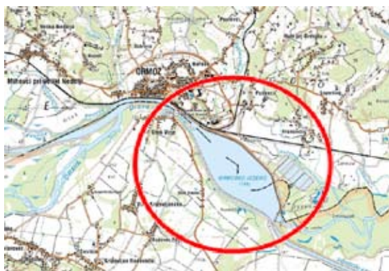
Reka Drava z Ormoškimi jezerom, lagunami in kanali

poplavnosti dolvodnih urbanih ter kmetijskih območij;