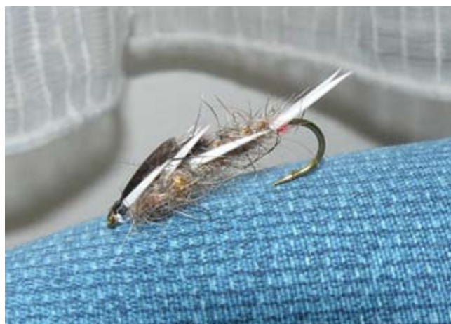
Imitacija kamenjarke (Stonefly)

pol sedmo zjutraj sem že stal sredi vode. Pod starim kamnitim mostom, ki so ga podrli in na njegovem mestu postavili novega, je bil velik tolmun, nekaj metrov nižje pa lep preliv, ki se je zлил v še lepši tolmun. Na staro, a dobro Greysovo palico, #5, ki jo redno uporabljam še vedno, in Greysovo rolo sem navezal predvrnico, debeline 0,18 mm, na njen konec pa večjo kamenjarko, ki sem jo kupil v začetku meseca. Že po nekaj metih sem ujel manjšo šarenko in ko sem jo izpustil, je sredi tolmuna nekaj završalo. Opazil sem, da je nekaj manjših belic, ki se rade držijo v mirnih predelih, poskakovalo zunaj vode, kar je nakazovalo, da se dogaja nekaj zanimivega. Muho sem vrgel v smer dogajanja, počakal delček sekunde, da bi se potopila, nato pa naredil nekaj kratkih potegov. Naenkrat se je palica ukrivila, na koncu predvrvice pa sem začutil težo. Že po nekaj sekundah boja sem vedel, da je tokrat na drugi strani ogromna riba. Ko sem nekaj trenutkov pozneje zagledal še njen