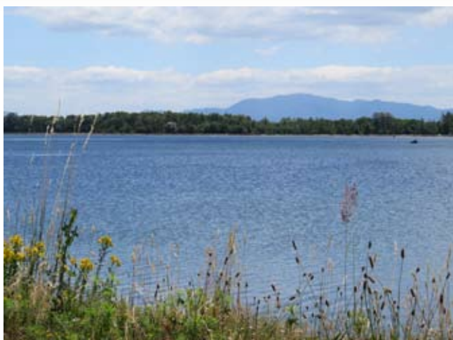
Jezero od blizu

elektrarn prestregle glavnino teh plavin, so pa te dosegle tudi Ormoško jezero in ga bodo polnile še naslednja desetletja. Kolikšna je današnja zaplavljenost akumulacijskega prostora Ormoškega jezera mi ni znano. Sodeč po tistem, kar sem videl ob njegovih zadnjih obiskih in kar so ribiči zaznali leta 2017 ob njegovem praznjenju, pa ocenjujem, da je ta za energetike verjetno že zaskrbljujoča. Zaskrbljujoča pa je tudi za ribiče zaradi geomorfološkega preoblikovanja dna in nastajanja obsežnih talnih depresij v katerih ob spuščanju jezera ostajajo ribe, posledica pa je njihova povečana mortaliteta in olajšano plenjenje ribojedih ptic.