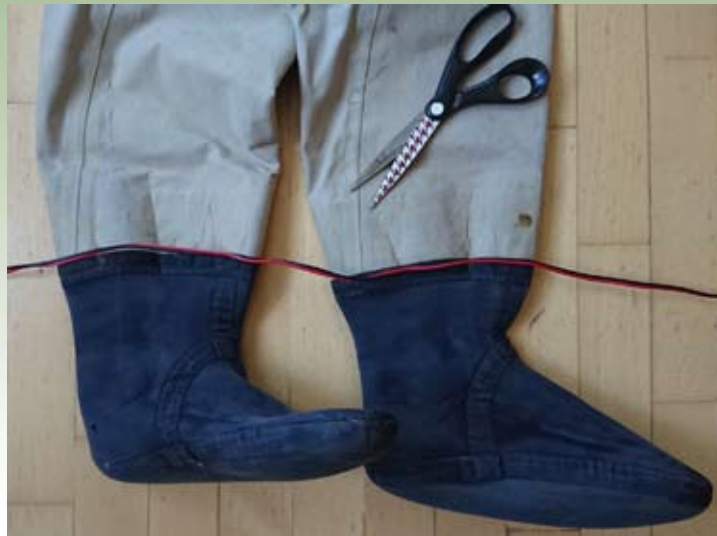
Prikaz mesta reza, s katerim dobimo hlače in neoprenske nogavice.

prepletene korenine obrežnih drevce, odprtino med dvema grmoma, ki si sledita v smeri s tokom in podobno. Velikokrat tam opazimo tudi ribo, ki