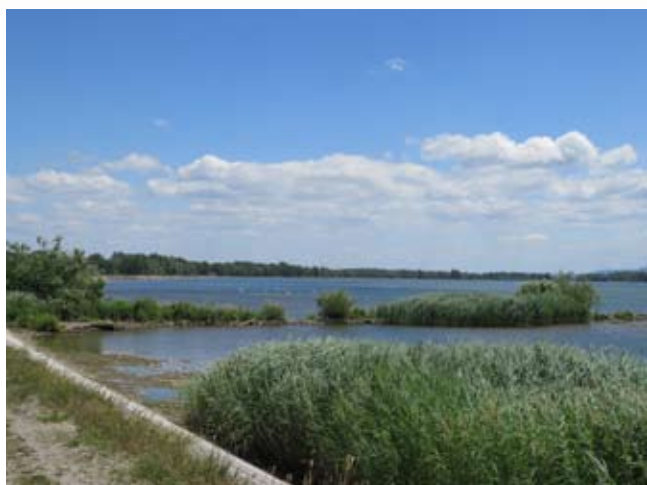
Lokalne plitvine z zarastjo makrofitov so postale življenjski prostor za jate zaroda in mladi rib ter gnezdenje ptic