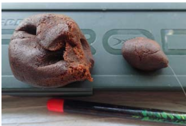
Oba prijema prvega julija sem imel na testo z vonjem po zelenem jabolku. Vse sestavine zanj so namenjene človeški prehrani.

Čas je tekel in vse bolj je kazalo, da bom znova poraženec, zmago pa bodo odnesli linji, kot že nekajkrat. »Morda