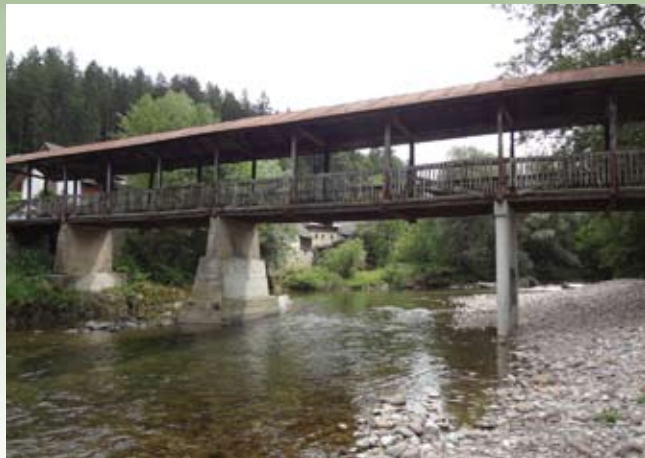
Značilni pokriti most, v ozadju mlin

Imam odlično ekipo sodelavcev, s katero se lahko lotimo vsake akcije ne glede na vreme ali letni čas. Z veseljem se tudi družim v našem domu in ravno to je tisto, kar nam daje dodatno veselje. Za stanje v vodi se trudimo, da bi bilo boljše, vendar žal ni vse odvisno od nas. Koncesijska pogodba, po kateri gospodarimo z reko v območju Natura 2000, nas zavezuje, obenem pa ugotavljamo, da je naš vpliv na dogajanja v reki in ob njej minimalen. Posege, na katere opozarjamo s prijavi na pristojnih organih, obravnavajo z zamudo ali pa jih sploh ne. Tu bi bilo treba marsikaj spremeniti oz. urediti.