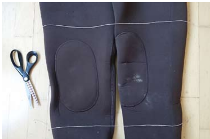
Prikaz mesta reza, s katerim dobimo neoprenske ščitnike za kolena za naše nove hlačne škornje

Zlomljene palice in kolesca so malo manj uporabna, še vedno pa lahko s palic poberemo dovolj ohranjene obročke in jih shranimo, včasih lahko shranimo tudi držalo kolesca. Tisti, ki uporabljamo isti model kolesca na različnih palicah, lahko s polomljenih kolesc vzamemo kolute in dobimo rezervne za drugo vrstico. Včasih lahko