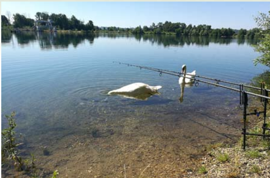
Obisk med ribolovom

Adrenalin, ki sem ga doživel, mi ni pustil več spati. Opazoval sem prelep sončni vzhod in labode na vodni površini, šel sem še pozdravit rakce v plitvino in dopoldne je minilo kot bi mignil. Popoldan se je vreme