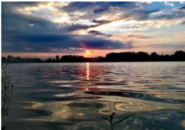
Narava se ob sončnem zahodu umiri

jo zamenjal, saj sem imel občutek, da trnek ni dovolj oster, ter ponovno nastavljal vabo na isto mesto kot poprej. Upanje je tlelo v meni in nov zagon je na soncu kar puhtel iz mene.