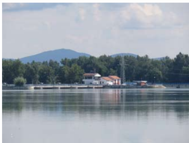
Ormoško jezero na odvzemu energetske vode in povratku osiromašenih količin preko zapornic v staro strugo Drave

( Carassius gibelio ), krap ( Cyprinus carpio ): potrjena prisotnost divje in gojene v., srebrni tolstolobik ( Hypophthalmichthys molitrix ), sivi tolstolobik ( Hypophthalmichthys nobilis );