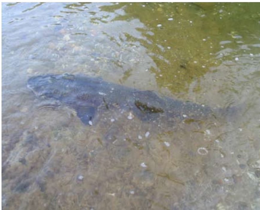
Soška postrv pri počitku po ulovu

V začetku zadnjega tedna v maju sem bil nemiren. Ponedeljkov dan v službi je bil že tradicionalno naporen, poleg tega pa sem se dan prej potikal po dolini reke Radovne. Kljub lepemu vremenu je bil ribolov slab, zato sem se odločil, da bom naslednji dan v službi vzel dopust. Torkovo jutro