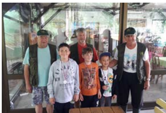
Najboljši v kategoriji U-10

Na taboru so se mladi ribiči seznanili z naslednjimi vsebinami: