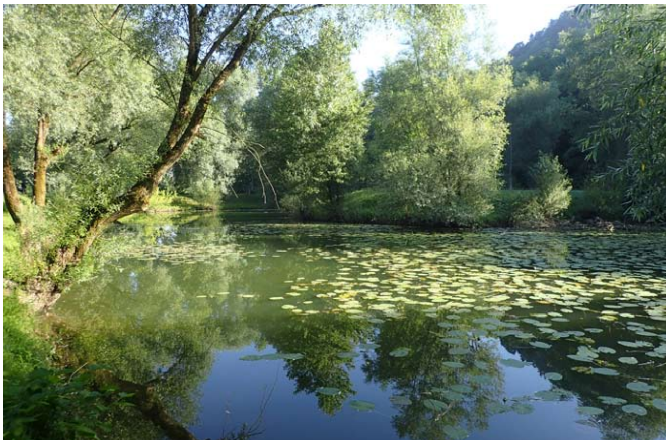
Krnica, linjevo kraljestvo, obsijana z jutranjim soncem.

V soboto dopoldan sem si ogledal vodo in potencialna lovna mesta za ponedeljkov ribolov. Krnica, Kačji brlog, Ljublanica. Še najbolj me je pritegnila Krnica. Voda je bila sicer dokaj nizka, a