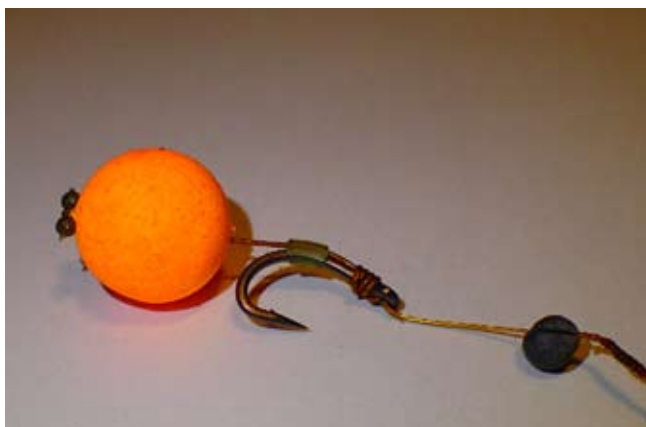
Ta plavajoči bojlji je bil krap dovolj zanimiv, da ga je pobral.