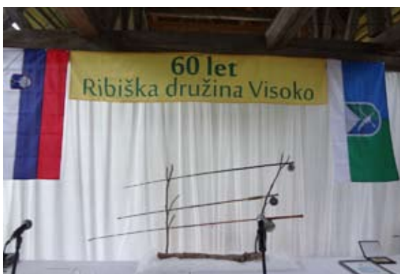
Tavčarjeve ribiške palice, stare 100 in več let

Kranjskem razdelil na revirje, s katerimi so upravljali zakupniki. Veljavo navedenega zakona so leta 1937 razširili na celotno Slovenijo. Franke slovi kot pisec