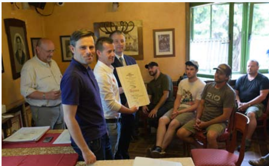
Zaključek MVK, Jesenice, Sava Dolinka, 15.06.2019-1-2