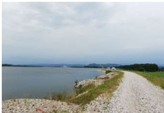
Trasa RD Brežice, kjer je potekal dobrodelni ribolov.