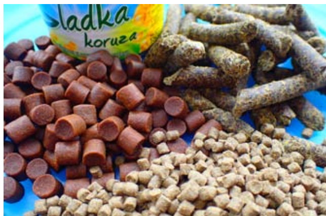
Ribolovno mesto sem nakrmil z briketi za postrv, konopljinimi briketi in briketi za krape. Dodal sem še nekaj zrn sladke koruze. Na drugem ribolovu sem dodal še mrtve kostne črve.

zeblo, tako da je bila stara jopa iz flisa, ki jo imam vedno v avtu, dobrodošla. V tistih dneh je temperatura zraka precej padla, kar je za ribiče na bregu dobro, upal pa sem, da se bo tudi ribam prileglo nekaj svežine po soparnih in vročih dneh in nočeh.