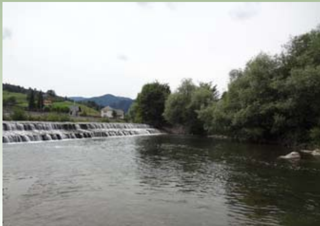
Revir RD Visoko

navzgor, sem zapenjal veje za seboj in ovire v vodi, uspeha pa ni bilo. Popravil mi je držo palice in mete ter mi dal ustrezne muhe. Tedaj se je začelo! Skoraj ni bilo dneva, da ne bi ujel kar nekaj lepih rib. Posebej lipanov je bilo veliko, ker je bila voda čista in okolica lepa! Sedaj je reka ista, vendar hitrejša, ni skrivališč za ribe, struga je nizka in ravna. Ponekod so reko brez potrebe razširili in jo obdali z kamnometi,