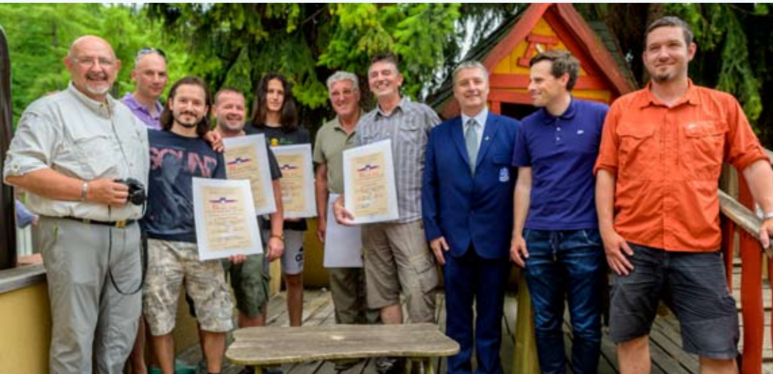
Zaključek MVK, Jesenice, Sava Dolinka, 15.06.2019-64