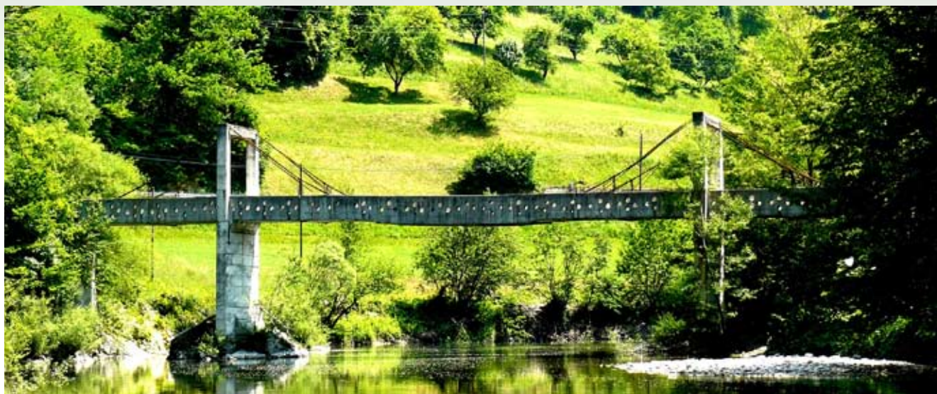
Pogled proti kamnitemu mostu pri naselju Reka

višje po toku, v nekdanji revir ujemi & spusti. Ker je bil zame dan že kar dolg, čakala pa me je še vožnja domov, nisem čakal morebitnega večernega skoka, ampak sem se pozno popoldne odpravil proti domu, kjer pa me je čakala še ena dogodivščina. Ko sem se iz Idrije vzpenjal proti Godoviču, se mi je naenkrat prižgala ena izmed kontrolnih lučk na armaturni plošči mojega takratnega avtomobila. Ustavil